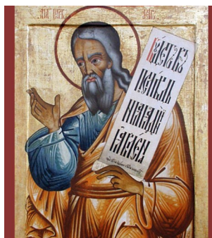
Prophète Isaïe Ancien Testament

Avec Jésus, nous assistons à la réalisation progressive des prophéties d'Isaïe. C'est cette bonne nouvelle qui est annoncée à Jean Baptiste. Ce dernier a été incarcéré car il gênait les autorités en place. Du fond de sa prison, il réfléchit. Il se pose beaucoup de questions sur Jésus. Ce qu'il entend dire de lui ne correspond pas à ce qu'il avait annoncé ; il profite d'un parloir pour demander à ses fidèles disciples d'aller lui poser la question la plus importante : « Es-tu celui qui doit venir ou devons-nous en attendre un autre ? » [...]