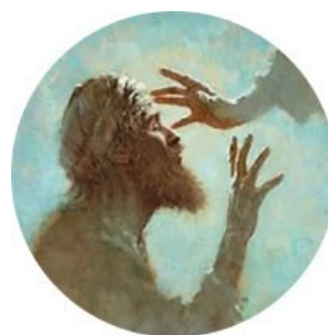
Jésus fait des miracles

Comme Jean Baptiste, nous pouvons aussi être enfermés dans nos doutes, nos questions. Nous pouvons aussi nous enfoncer dans des certitudes qui ne sont pas la vérité de l'Évangile. Trop souvent, nous nous faisons une fausse idée de Jésus. Il sera toujours bien au-delà de tout ce que nous pourrions dire ou écrire de lui. Avec l'Évangile de ce jour, nous comprenons que notre Dieu n'est pas un Dieu vengeur mais un Dieu qui relève et qui sauve. Les pauvres, les petits et les exclus ont la première place dans son cœur.