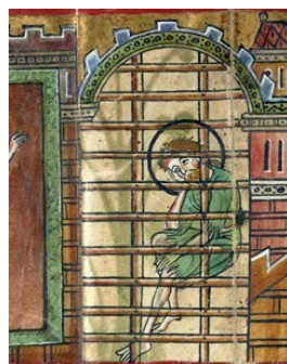
St Jean Baptiste en prison