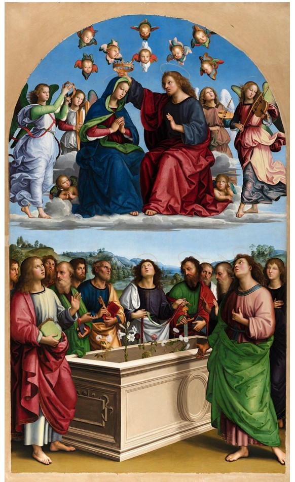
Raffaello Sanzio, Couronnement de la Vierge

Cette contemplation renforce enfin la confiance dans l'intercession de Marie : la voilà toute disponible pour « guider et soutenir l'espérance de ton peuple qui est encore en chemin ».